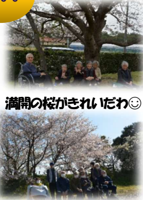
満開の桜がきれいだわ◎

デイサービスでは、地域外(湖陵・神西・佐田)からのご利用者も受け付けております。お気軽に声をかけて下さい!