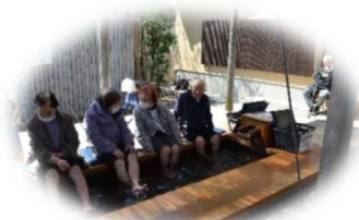
足湯、気持ちよかった♪