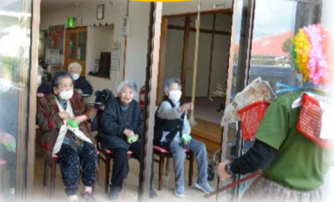
鬼は外〜、福は内！今年も元気で1年いこう！

デイサービスでは、随時見学・体験を受け付けております。お気軽に声をかけて下さい！