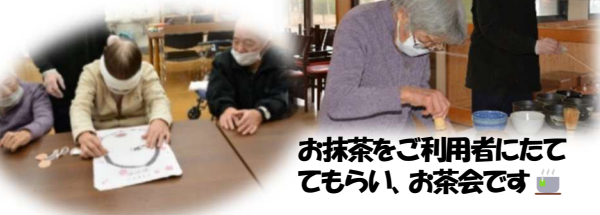
お抹茶をご利用者にてもらい、お茶会です

ご利用者から「毎日のアクティビティが楽しい、ボランティアさんが、来られると賑やかでいいわ。」と喜んでいただいています。