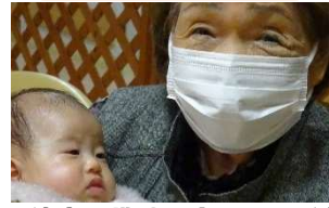
育休中の職員が赤ちゃんを連れて来てくれました。

デイケアでは医師、理学・作業療法士、看護、介護職員がチームで皆様の在宅生活を支援します。マンシヤストレッチなどのリハビリを行っています。