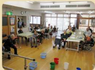
入浴後の思い思いの午後とアクティビティー