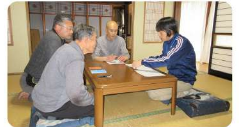
ご利用者宅でのサービス担当者会