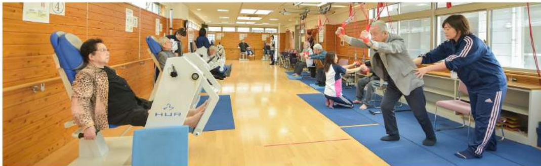
専用の施設で専用の器具を使用して、作業療法士・理学療法士がリハビリを指導します。