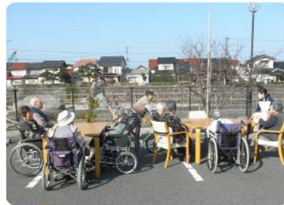
「その人らしさ」 みんないきいき