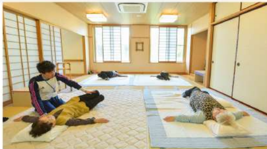
自宅内を想定した畳の上での動作練習

要支援1、2、要介護1～5の方がご利用できます。 ご自宅から施設に通い、理学療法士・作業療法士などによる専門的な機能訓練(リハビリテーション)や看護職員・介護職員による健康チェック、レクリエーション、入浴などを提供します。 医師・療法士、看護・介護職員がチームで在宅生活を支援します。