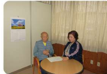
事業所相談室での相談

住み慣れたご自宅で快適な生活を継続していただくために、介護支援専門員(ケアマネジャー)が一人ひとりに最適なケアプランを作成しサポートいたします。