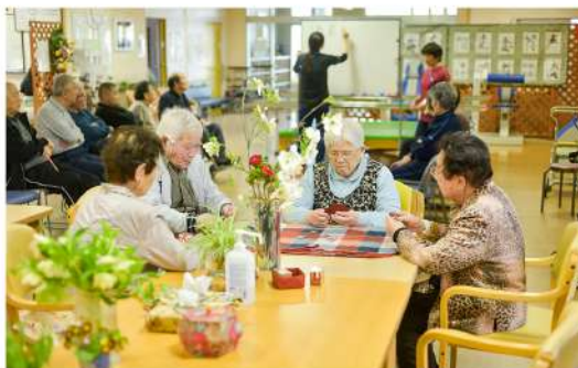
交流を通し心身ともに活発に