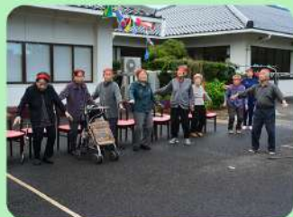
そのために毎日励む機能訓練