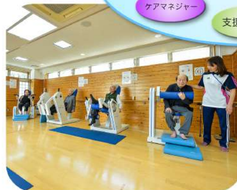
リハビリテーションルーム訓練