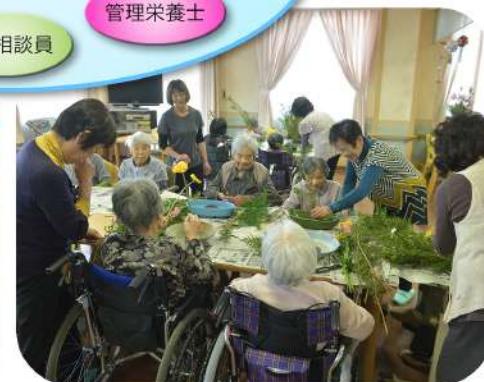
趣味活動 生花クラブ活動風景