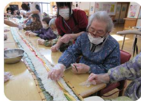
ジャンボのり巻き作り